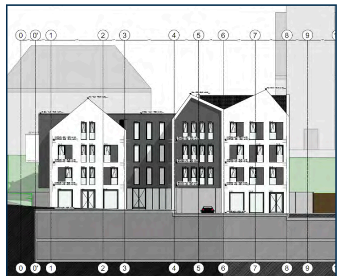
Südansicht des erweiterten Ärztehauses.